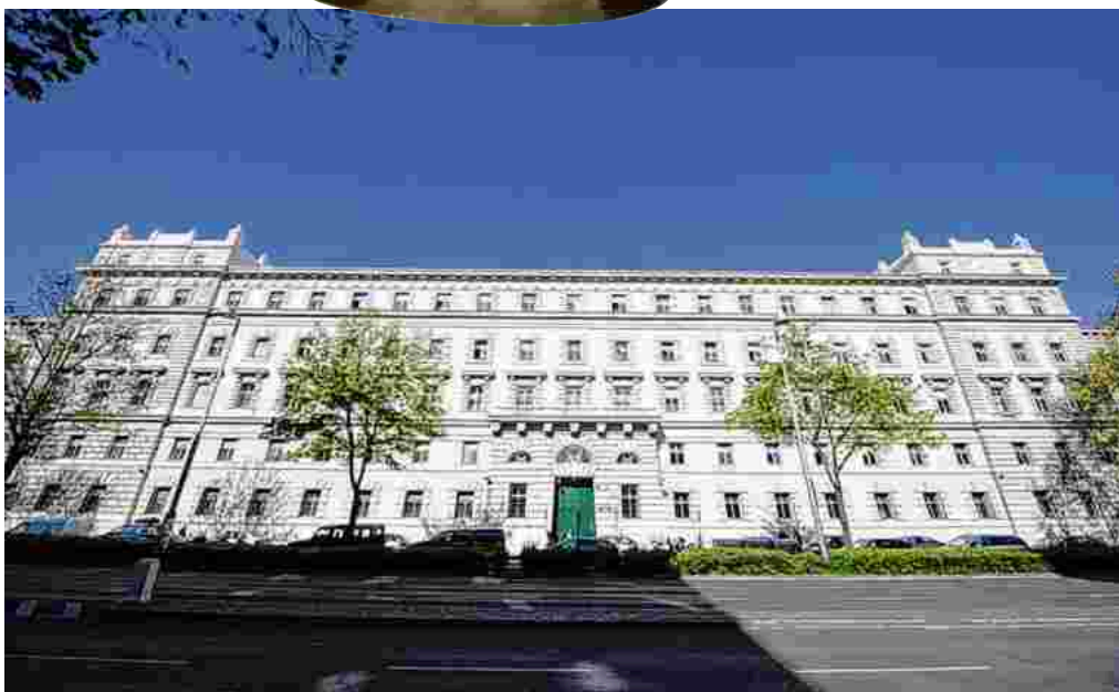
Hier finden auch Korruptionsprozesse wie der Fall Buwog statt: das Straflandesgericht Wien

Der Begriff „Korruption“ als solcher hat erst mit dem Korruptionsstrafrechtsänderungsgesetz 2012 Eingang ins österreichische Strafbuch gefunden, wie Höllner betont. Damals wurden auch die Strafbarkeitsbestimmungen etwa bei Vorteilsannahme und verbotener Intervention verschärft bzw. ausgeweitet.